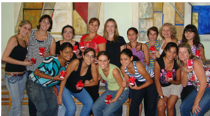
Funcionárias da Catálise na comemoração

Para elas, o Dia Internacional da Mulher é muito mais especial frente a todas as conquistas que a mulher obteve ao longo do tem-