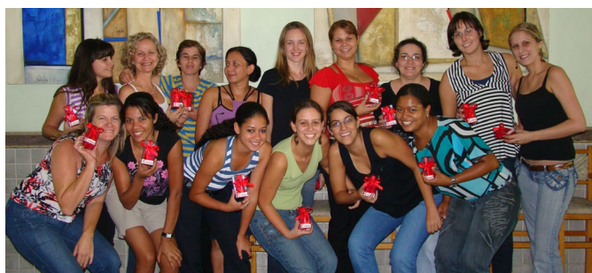
As funcionárias ganharam uma lembrancinha da empresa