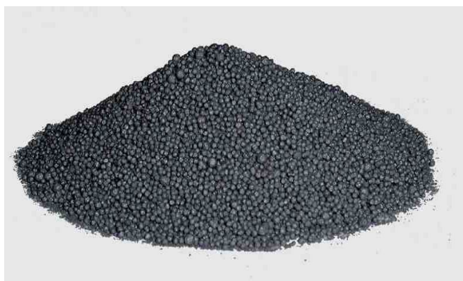
Pó de Ferro H

Conheça o Pó de Ferro H, produto de extrema importância para os eletrodos de solda da Catálise. Saiba como é feito o processo de produção, os cuidados na formulação, quais as aplicações e para onde este produto é enviado.