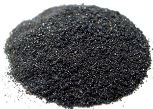
Pó de Ferro H

O Pó de Ferro H é um produto de extrema importância na linha de pós para eletrodos de solda da Catálise. Ele é o pó mais utilizado em suas composições, pois é a base das ligas de aço, que compõem a maior parte do mercado de soldagem.